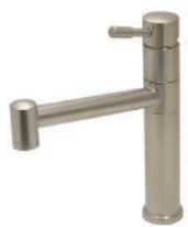
SSK161 ステンレス・ シングルレバー キッチン混合栓 (トールタイプ)