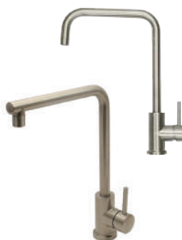
SSK191 SSK134 ステンレス・ シングルレバー キッチン混合栓