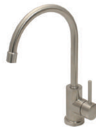
SSK192 ステンレス・ シングルレバー キッチン混合栓