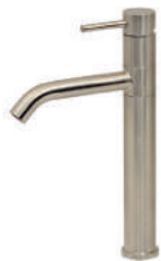
SSL166 ステンレス・ シングルレバー 洗面用混合栓