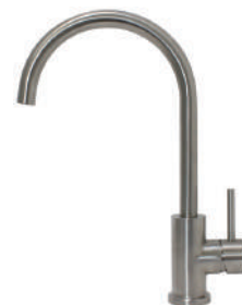
SSL106 ステンレス・ スワン単水栓