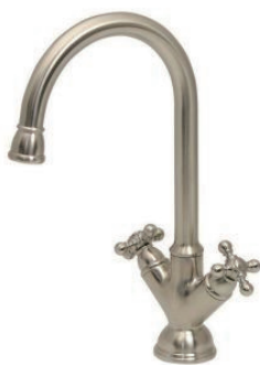
SSK200 ステンレス・2ハンドル キッチン混合栓