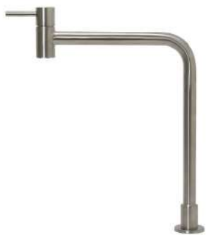
SSK2504KM-N ステンレス単水栓 ウォーターサーバー・浄水器用