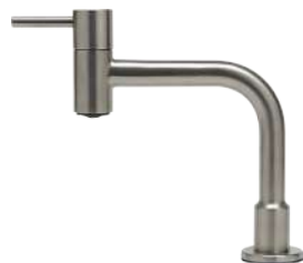
SSL2501KM-N / SSL2502KM ステンレス単水栓 (洗面・手洗用)