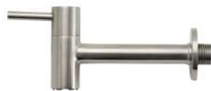
SSG2506KM ガーデン水栓 (ロング)